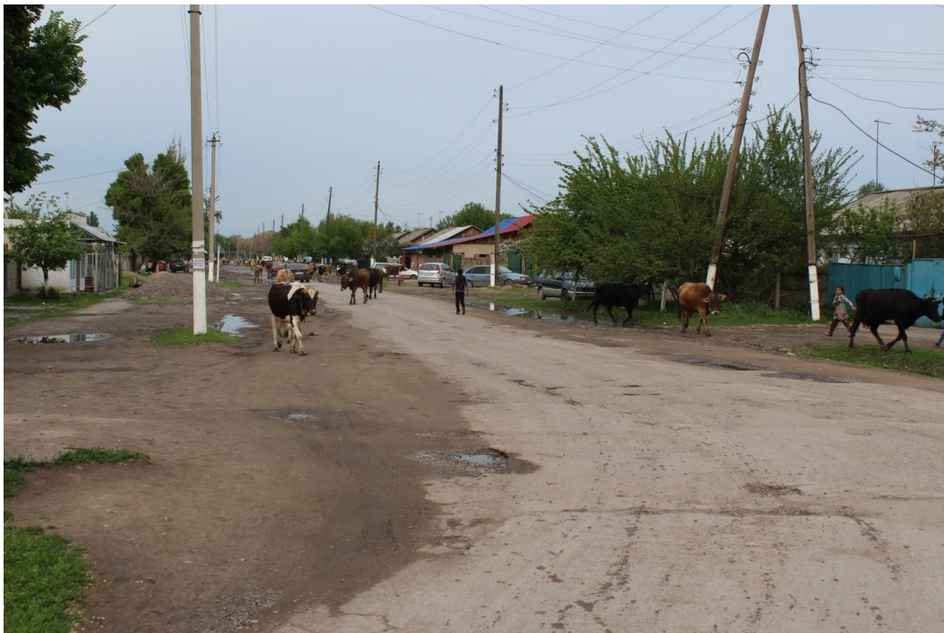
Winogradnoje/Kirgisistan, Foto: Sarah Münch/GAW

Mit * markierte „e“ sind immer wie ein „e“ am Ende des Wortes „Birne“ auszusprechen.