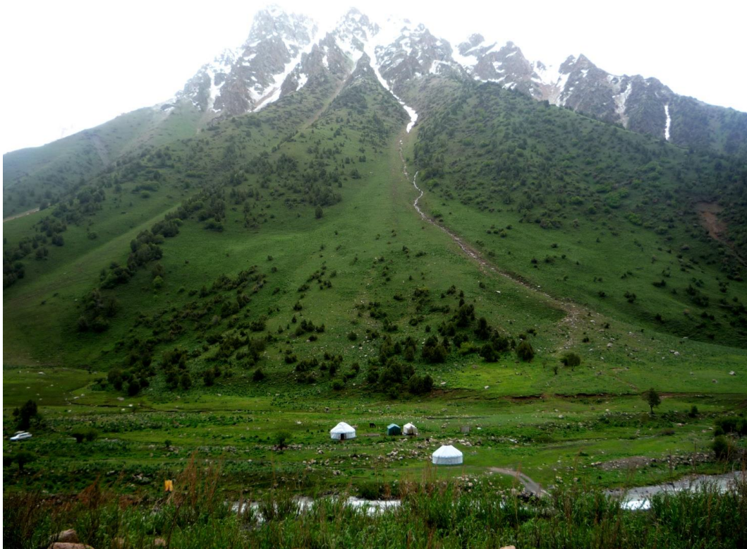
Landschaft in Kirgistan