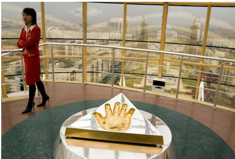
Bild 1: Der Bajterek-Turm in Astana/Kasachstan. Der Turm wurde von Norman Foster entworfen und soll einen an Schöpfungsmythen erinnernden Lebensbaum mit einem Ei symbolisieren; Bild 2: Holzskulptur mit Unterschriften religiöser Vertreter oben auf dem Bajterek-Turm; Bild 3: Unterschrift des Lutherischen Weltbundes. Bild 4: Abdruck der Hand des Präsidenten auf dem Bajterek-Turm.