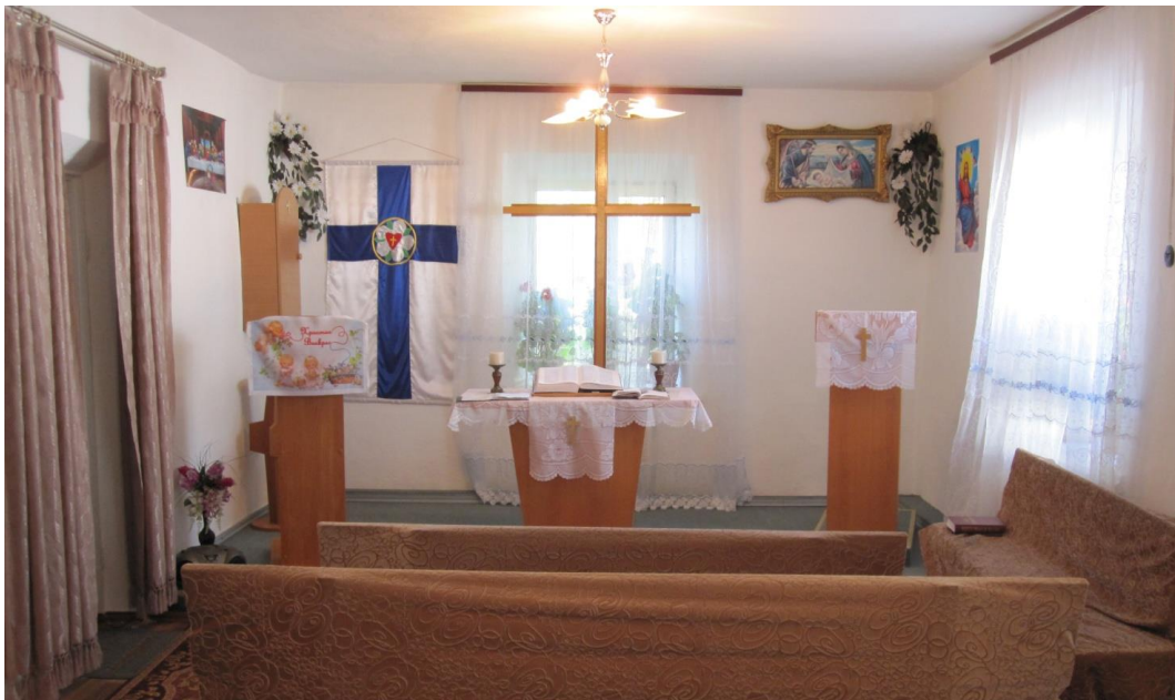
Kamyschenka, Kasachstan

1 Weiter, ihr Brüder und Schwestern, betet für uns, dass das Wort des Herrn laufe und gepriesen werde wie bei euch 2 und dass wir gerettet werden vor falschen und bösen Menschen; denn der Glaube ist nicht jedermanns Ding. 3 Aber der Herr ist treu; der wird euch stärken und bewahren vor dem Bösen. 4 Wir haben aber das Vertrauen zu euch in dem Herrn, dass ihr tut und tun werdet, was wir gebieten. 5 Der Herr aber richte eure Herzen aus auf die Liebe Gottes und auf das Warten auf Christus.