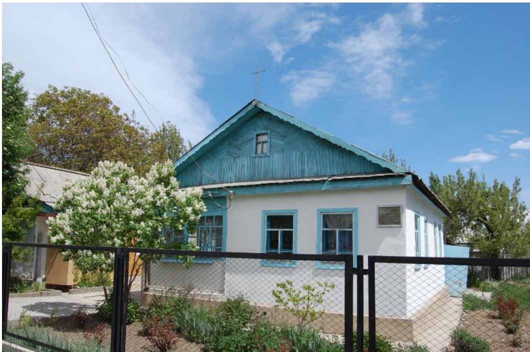
Kirche in Ananjewo/Kirgisistan, Foto: Enno Haaks/GAW

Heute hatten sie sich fast gestritten, über die Kirche, oder besser: über Gott. Als er wieder in sein Zimmer zurückgekehrt war, musste er nochmals an Martin denken. Martin hatte behauptet, dass es doch eigentlich eine Zumutung sei, wie viel Macht sich die Kirche im Laufe der Zeit angeeignet hatte, und der Staat nutze das auch noch aus. Die Menschen würden in Angst gehalten. In Angst davor, dass Gott sie nicht aufnehmen würde, wenn sie nicht täten, was ihnen die Obrigkeit vorschreibe.