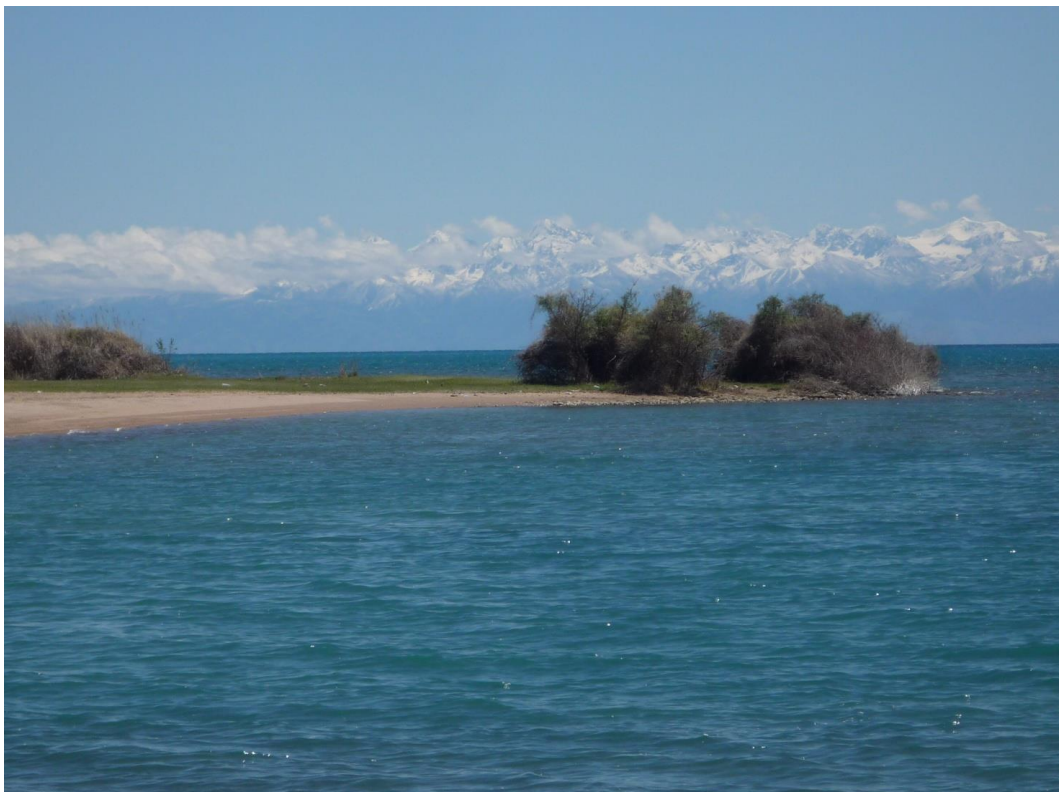
Yssykkul/Kirgisistan, Foto: Wilfried Henning/GAW

Im Jahr 2005 wurden hunderte Demonstranten in Andischan erschossen. Die EU verhängte daraufhin kurzzeitig ein Waffenembargo. Seit dieser Zeit beobachtet die Delegation der Deutschen Wirtschaft für Zentralasien eine zunehmende Isolation des Landes gegenüber dem Westen und sogar gegenüber Russland. So betrug das Bruttoinlandsprodukt pro Kopf im Jahr 2015 nach Schätzungen des Internationalen Währungsfonds (IWF) nur 2.202 US-Dollar. In Deutschland betrug es im selben Jahr 41.955 US-Dollar.