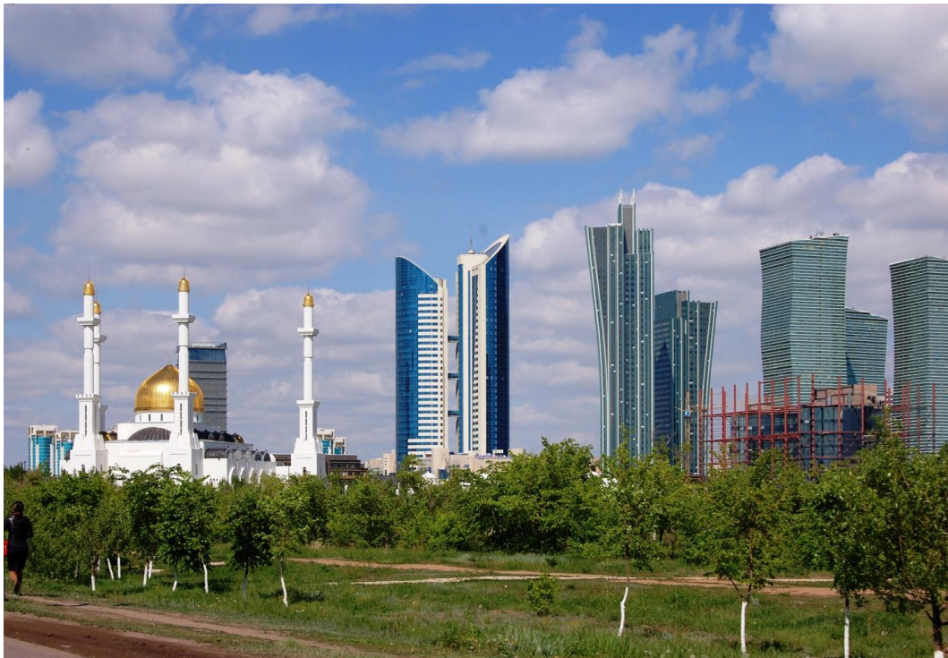
Panorama von Astana, Foto: Enno Haaks/GAW