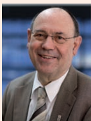
Präses Dr. h.c. Nikolaus Schneider Vorsitzender des Rates der Evangelischen Kirche in Deutschland

Herzlich grüßen wir Sie im Namen der Deutschen Bischofskonferenz und der Evangelischen Kirche in Deutschland und erbitten für Sie Gottes Segen. Wir wünschen Ihnen ein unvergessliches Sportfest mit fairen Wettkämpfen, vielen guten Begegnungen und eine gesunde Rückkehr nach Hause.