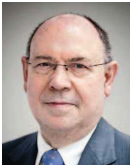
Reinhard Kardinal Marx Vorsitzender der Deutschen Bischofskonferenz